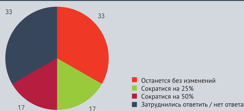
Рисунок 2. Как изменится благотворительный бюджет да конца года в сравнении с планом, % от числа опрошенных