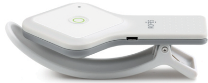
Аппаратно-программный комплекс для оценки функционального состояния ROFES E01C