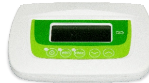
Модуль для оценки состояния новорожденного «Апгар-таймер»