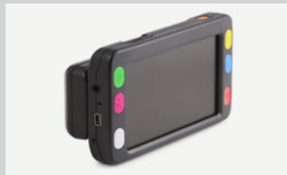
Электронный видеоувеличитель для людей с ослабленным зрением ЭРВУ