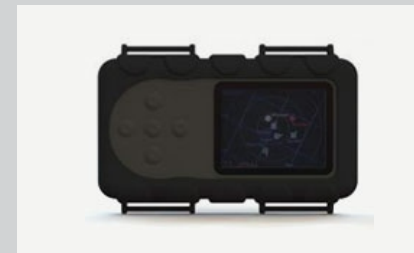
Тактический GPS/GLONASS Навигатор