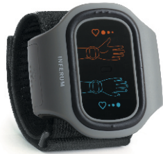
Электростимулятор для коррекции артериального давления ABP-051