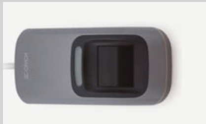
Дактилоскопический сканер ДС «Орион» для регистрации и контроля