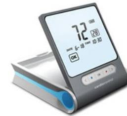
Портативный электрокардиографический прибор для оценки работы сердечно-сосудистой системы (ССС) и механизмов регуляции организма по варибельности сердечного ритма (BCP)