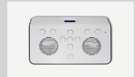
Тифлофлешплеер для прослушивания говорящих книг